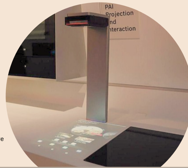
Chef. Il proiettore Pai Bosch riconosce i cibi e suggerisce le ricette più adatte oltre a ordinare le provviste che stanno finendo

Domotica All'Ifa di Berlino le ultime tendenze per rendere la casa più smart con app e comandi vocali